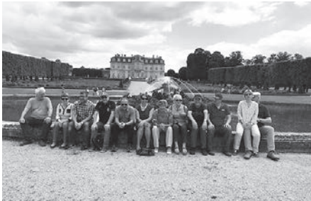
Die Lindauer Bouler und ihre französischen Kollegen vor dem Chateau Champs sur Marne

Was ein echter Bouler ist, der lässt sich davon kurz vor dem Sieg nicht abhalten. Flüchteten die Zuschauer ins Trockene, so brachte das Wetter die sechs Finalisten nicht aus der Ruhe. Sie erspielten völlig durchnässt den Sieger. 13:12 war das äußerst knappe Ergebnis. Und da es nur einen Sieger geben kann, waren dies