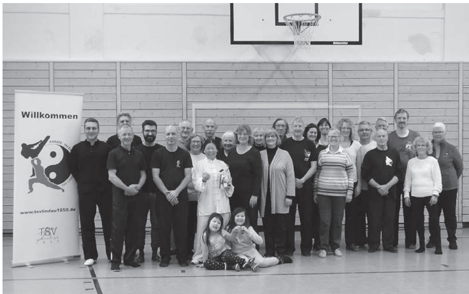
Gruppenbild der Teilnehmer