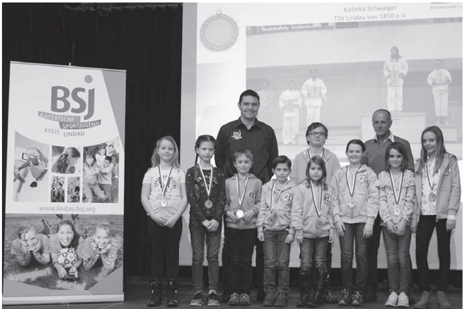
Die erfolgreichen Judoka