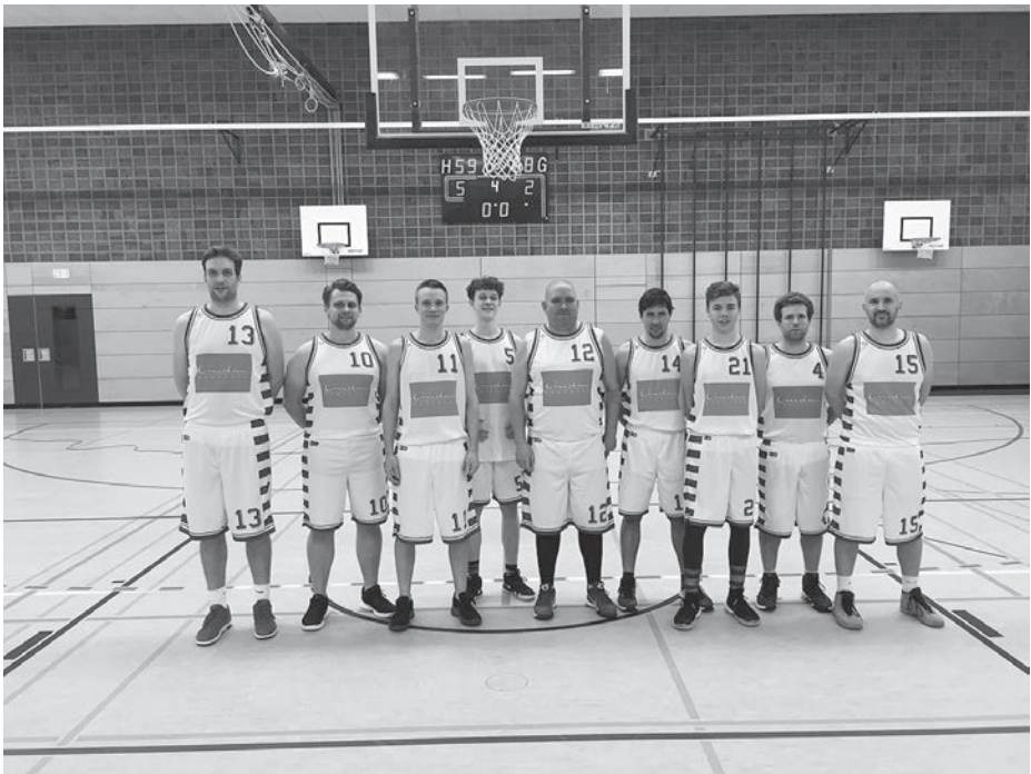
Das (auch unvollständige) Team der Lindauer Herren