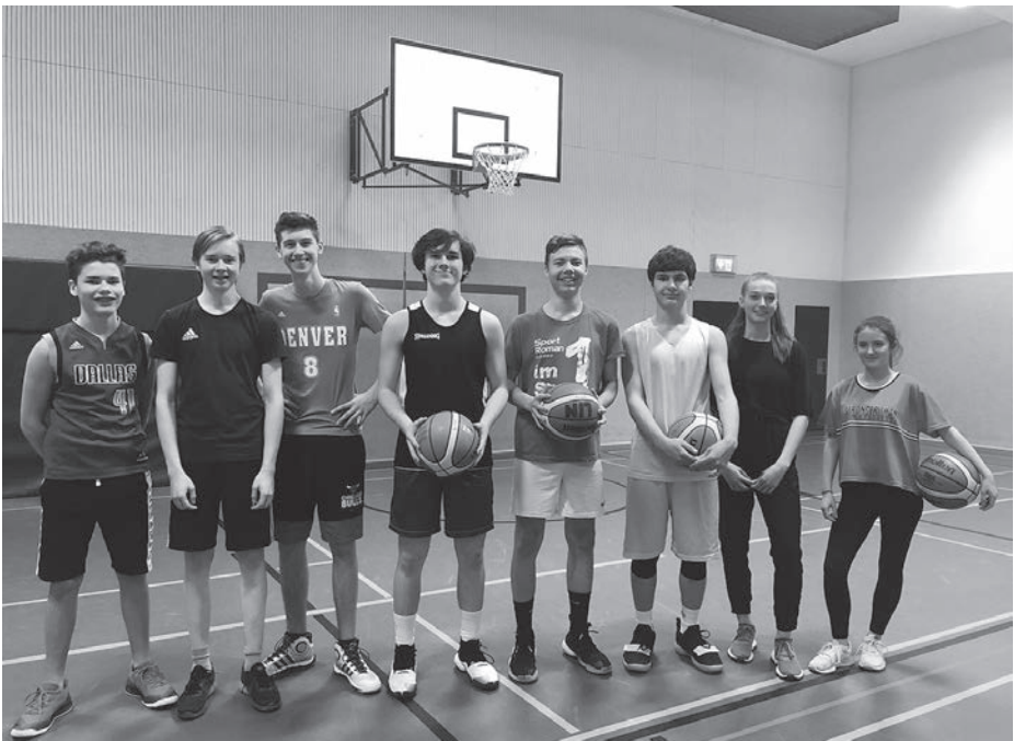
Das (leider unvollständige) gemischte Team der U16/U18

bis 20 Jugendliche in der BoGy-Halle und jagen begeistert dem orangenen Ball hinterher. Auch bei der U14-Mannschaft sind ständig neue Gesichter zu sehen. Die Abteilungsleitung wird zusammen mit den Trainern schauen welche Teams in der Saison 2019/2020 Sinn machen und dann gemeldet werden. Sicherlich sind alle aktuellen U14-Spieler wieder Feuer und Flamme im Bezirk Schwaben auf Korbjagd zu gehen nachdem sie in der aktuellen Saison bereits zwei Siege einfahren konnten.