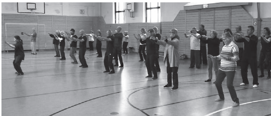
Wecke das Chi