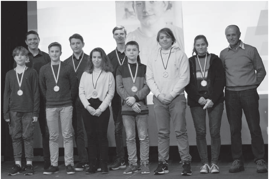
Die erfolgreichen Schwimmer