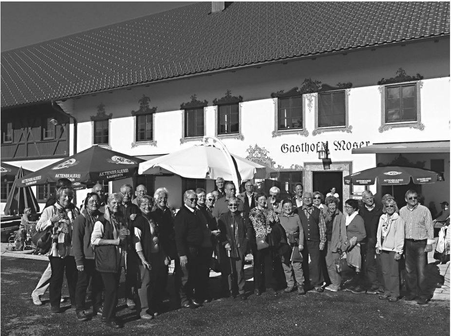
Die Reisegruppe des TSV vor dem Gasthaus

In der Wallfahrtskirche erwartete die Gruppe ein Führer, der sehr eindrücklich die Geschichte der Kirche und die einzelnen Bauelemente sowie Fresken erläuterte. Die Kirche wurde 1745-1754 von den berühmten Baumeistern und Stukkateuren Domenikus und Johann Baptist Zimmermann geschaffen. Die Kirche wurde gebaut, um einer Prozessionsfigur aus dem Jahre 1730 einen würdigen