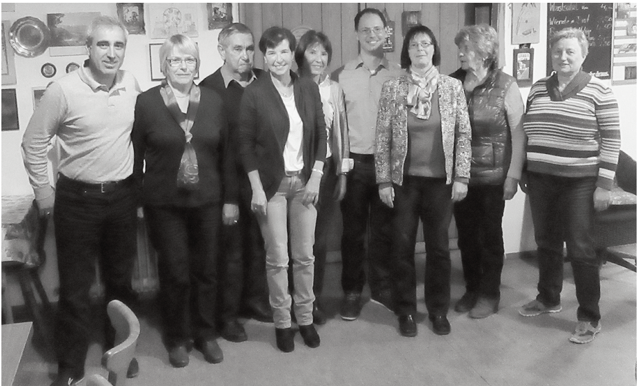
Ehrungen langjähriger Mitglieder bei der diesjährigen Jahreshauptversammlung